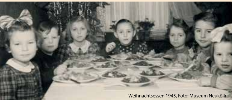
Weihnachtsessen 1945